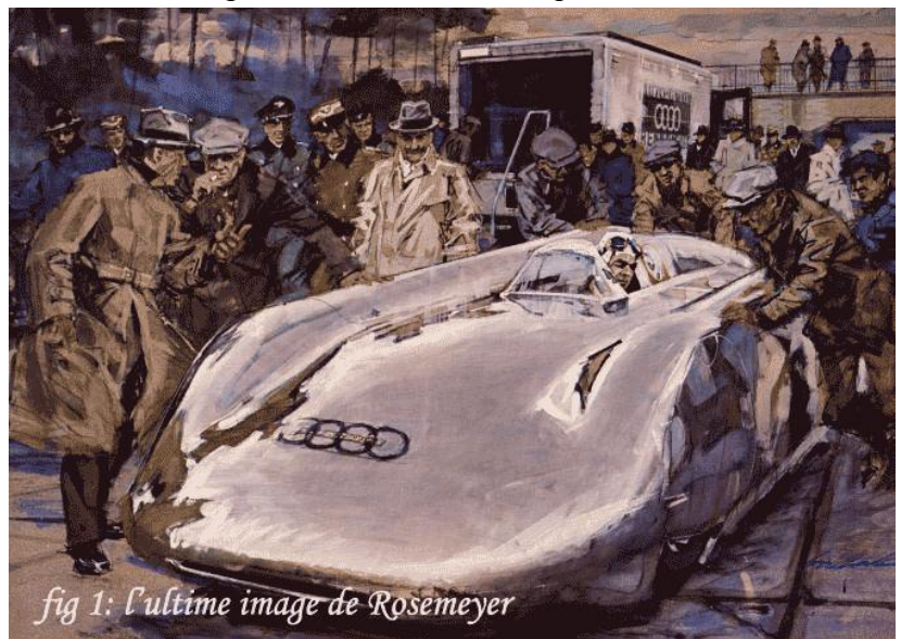
fig 1: l'ultime image de Rosemeyer

Pendant cette période il continue à produire catalogues, affiches ou calendriers pour les magazines automobiles, (en particulier Automobile Quaterly et Road and Track), les musées, et d'autres constructeurs ou industriels du secteur automobile comme Ford, Austin, Fiat, Shell ou GoodYear.