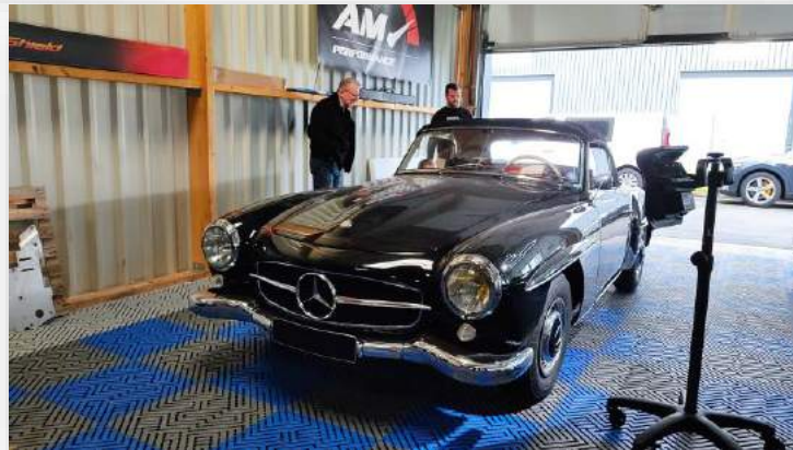
La 190 SL à préparer pour le concours d'élégance